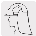
Fijación hook and loop