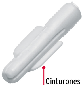
Cinturones de resistencia y anclas retráctiles de fijación