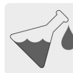
Resistente a ácidos