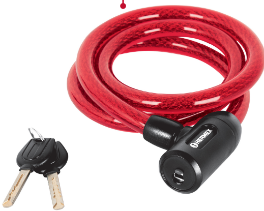
Cable de acero trenzado