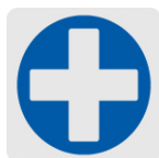
Punta de cruz