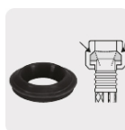
Empaque antifuga con diseño cónico