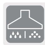
Mojado y seco