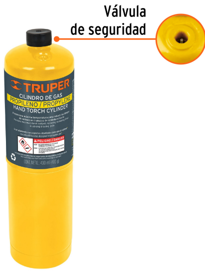
Válvula de seguridad