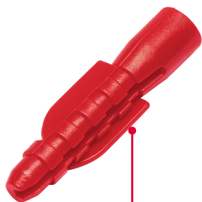
Cinturones de resistencia y anclas retráctiles de fijación