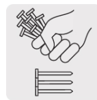
Presentación en caja con acomodo PARALELO que facilita el manejo