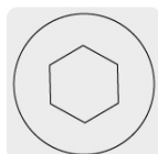
Entrada para llave allen