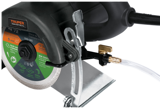
Sistema de lubricación de corte