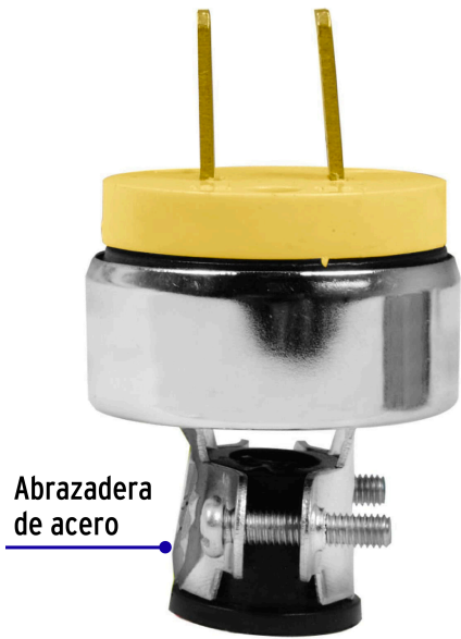
Abrazadera de acero