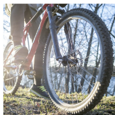
Llantas de bicicletas