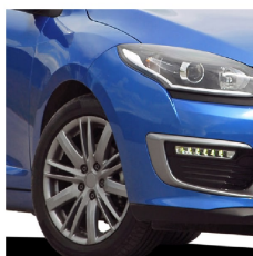
Llantas de automóviles