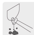
Martillo para romper terrones