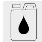
Aceite monogrado SAE30