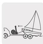
Remolque de embarcaciones