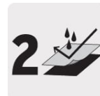
Capa de material PVC / Poliéster