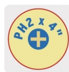
Marcado y código de color