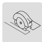
Para sierra circular